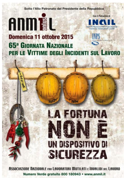
Il manifesto dell'Anmil