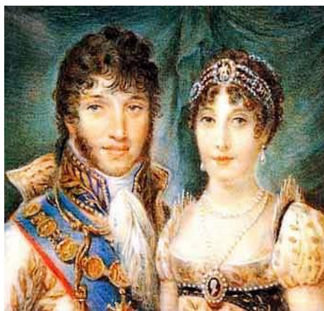
Gioacchino Murat e Carolina Bonaparte

interconnesse. C'è un decreto che interessa, in modo particolare, il comune di Zambrone, quello del 4 maggio 1811 numero 922, con cui la Calabria era divisa in due province: Citeriore, con capitale Cosenza e Ulteriore con capitale Monteleone. Ogni provincia veniva quindi divisa in quattro Distretti, suddivisi ulteriormente in Circondari e quest'ultimi in Comuni e Frazioni. Fu sempre per merito di Murat e grazie al citato decreto 922/1811, la creazione, in Calabria, di un sistema municipale d'ispirazione moderna. Nacque così, fra gli altri, anche il Comune di Zambrone. La celebrazione del bicentenario della morte di Murat (13 ottobre 2015) ha stimolato riflessioni e domande su questi due primi secoli di storia municipale. Quali sono i traguardi conseguiti? Quali gli obiettivi mancati? Come s'immagina il futuro della comunità? Ci sarà ancora spazio per l'autodeterminazione della propria storia? Murat rappresenta anche per questa comunità una sorte di spartiacque. C'è un prima Murat e un dopo. Dopo Murat le vicende di Zambrone e di altri comuni sono cambiate radicalmente. Ciò è valevole sotto il profilo formale, giuridico, istituzionale. Ma anche sotto quello strettamente politico. La municipalità ha offerto alla popolazione la possibilità di essere