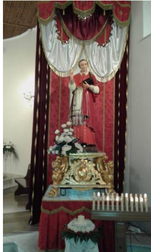
Statua di San Carlo Borromeo