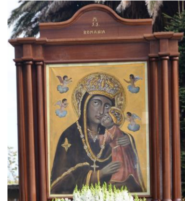
La sacra effige