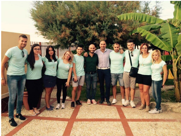
Gli allievi che hanno partecipato al convegno