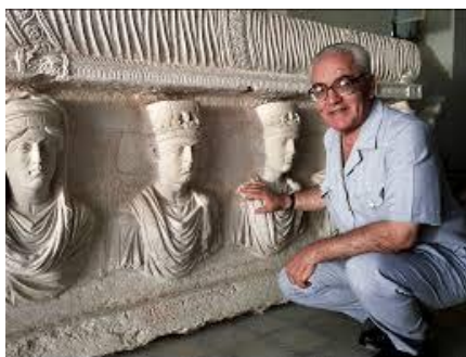
Khaled al Asaad