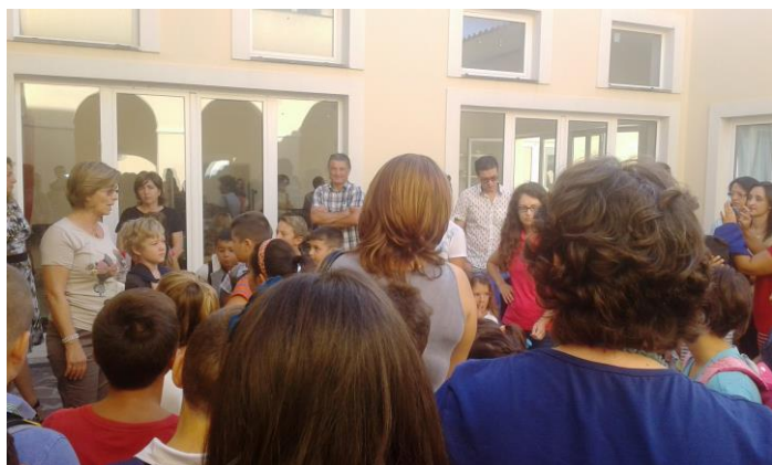
Zambrone, 14 settembre 2015 primo giorno di scuola

Il primo giorno di scuola è quel lunedì di settembre che gli studenti attendono e temono allo stesso tempo. Segna la fine della stagione estiva e l'inizio di tanti cambiamenti. Soprattutto per chi si ritrova a frequentare una scuola alle prese con tanti cambiamenti e novità. Nuovi insegnanti, compagni, ambienti e abitudini all'inizio suscitano un po' d'ansia. Ma poi s'incominciano ad intravedere i lati positivi. Nel primo giorno di scuola hanno il sopravvento sentimenti diversi: tensione, felicità, gioia, tristezza. E anche se non si vorrebbe ritornare alla routine è un piacere rivedere i vecchi compagni e insegnanti o conoscerne di nuovi. Immane le chiacchierate e gli scherzi con i compagni durante la ricreazione. E così la confusione e la felicità al suono della campanella. È un piacere tornare a scuola anche perché è l'ambiente in cui si studia ma anche quello in cui ci si ritrova coi coetanei e s'impara pian piano a relazionarsi con gli altri, adulti e ragazzi.