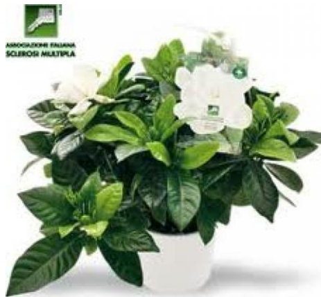
La gardenia distribuita per l'Aism