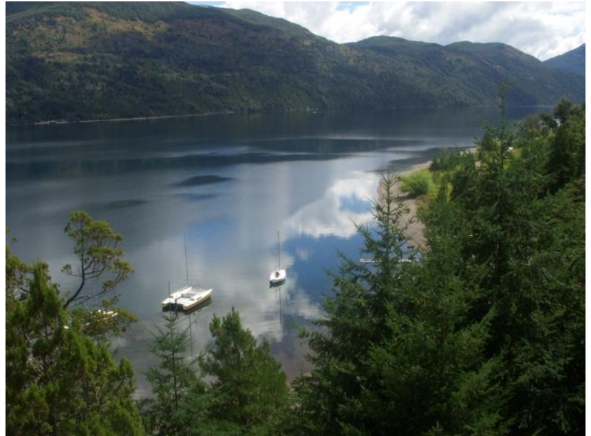
Scorcio della città di Esquel

Cari amici aramonesi, ho voluto condividere con voi il racconto delle mie vacanze nella città di Esquel, provincia del Chubut, nel Sud dell'Argentina, circa 2000 km da Buenos Aires. Sono andata nel passato febbraio e ho potuto sfruttare il magnifico paesaggio di montagne, laghi, boschi e la tranquillità di questa città di 40mila abitanti che il 25 febbraio compirà 107 anni di vita. La storia di questo luogo è curiosa: dai tempi remoti, vi abitavano diverse tribù indigene; dopo l'arrivo degli spagnoli, la provincia si spopolò e rimasero pochi abitanti. E ciò fino agli ultimi anni del diciannovesimo secolo, allorquando arrivarono gli immigrati gallesi a creare colonie nuove dedicate al settore agricolo e zootecnico. Da questi coloni, dai discendenti argentini, cileni e di altri immigrati è composta la società di oggi. Negli ultimi 30 anni, molte persone delle città del nord Argentina, si sono trasferite in questo sito per trovare tranquillità e bellezza, ed una maniera diversa di vivere. Adesso, mentre continua il lavoro nei campi, il turismo si sviluppa sempre di più. Il posto è diventato meta prediletta di argentini e stranieri: in estate, per esplorare