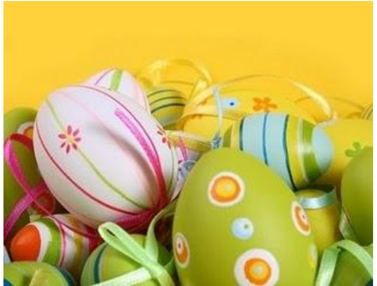
Uova di Pasqua