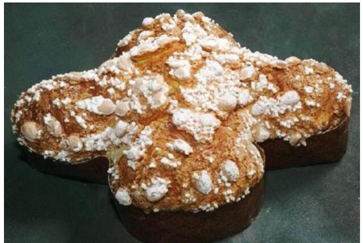
La colomba pasquale