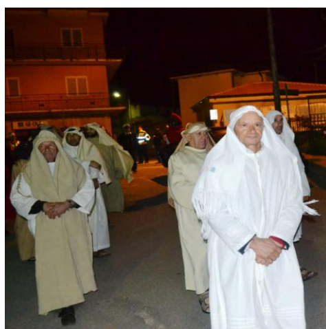
Personaggi della rappresentazione