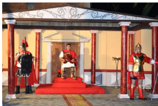
Il processo di Ponzio Pilato