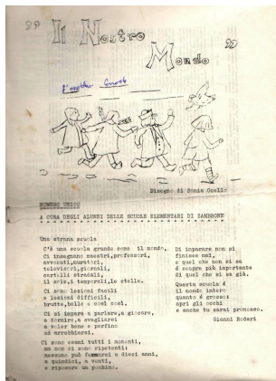
“Il nostro mondo”