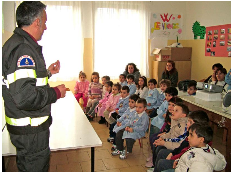
Un momento della lezione tenuta presso la scuola del capoluogo