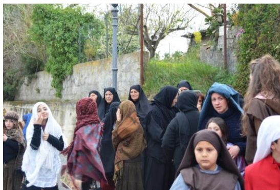
Donne alla sacra rappresentazione